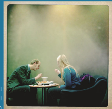
Kurs_Bildwechsel bei_Prof. Peter Fischer-Piel