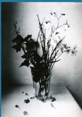
Kurs_Camera Obscura bei_Sibylle Hoffmann&Thomas Michalak