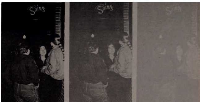
Abbildung 6: Shellburne Thurber, Detail of The Other Side, Boston, 1992, 1992.