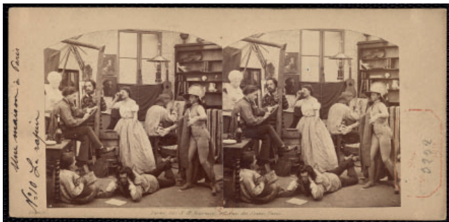
Abbildung 1: Furne fils & H. Tournier, Une maison à Paris, N° 10, 5e étage: Le rapin, 1860, Bibliothèque nationale de France

Thinking Photography. DGPh-Forschungspreis 2022 an Dr. Charlotte Bruns „Raumbilder und ihre Gebrauchsweisen. Zur Organisation des Sehens in der Stereofotografie“ Abbildung: 1, 2, 3, 4