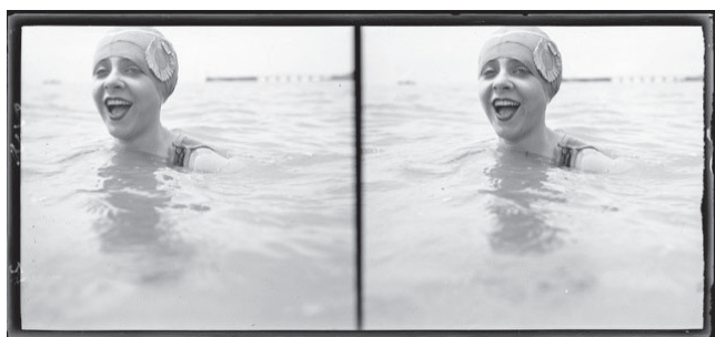
Abbildung 3: Jacques Henri Lartigue, ca. 1924