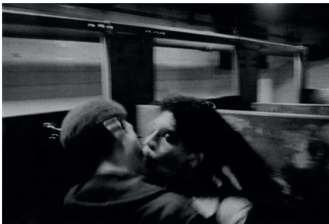
Abbildung 5: Christian Walker, Untitled from The Theater Project, 1982-83. Postcard, private collection.

Writing Photography. DGPh-Preis für innovative Publizistik an Jackson Davidow „Cruising Maryam Sahinyan’s photographic archive: Intertwining meanings of the archive between the personal and the public“ Abbildungen: 4, 5, 6