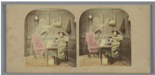
Abbildung 2: The London Stereoscopic Company (zugeordnet), The Ghost in the Stereoscope [Kindly suggested by Sir David Brewster, K.H.], 1857–1859, Rijksmuseum, Amsterdam